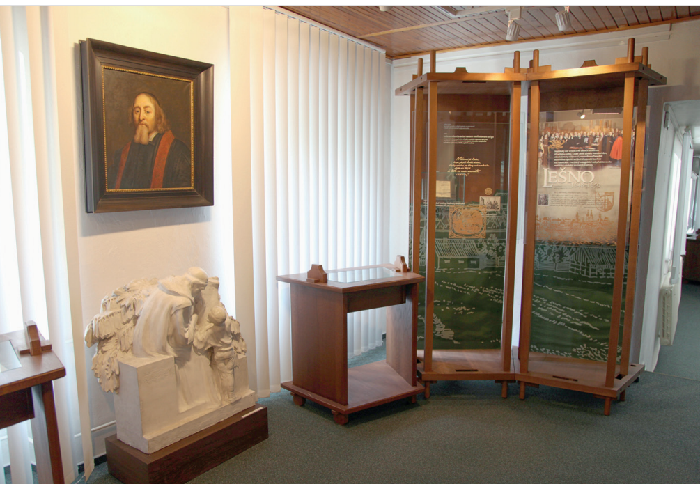
Pohled do expozice muzea Jana Amose Komenského

„Všichni na jednom jevišti velikého světa stojíme, a cokoliv se tu koná, všech se týče.“